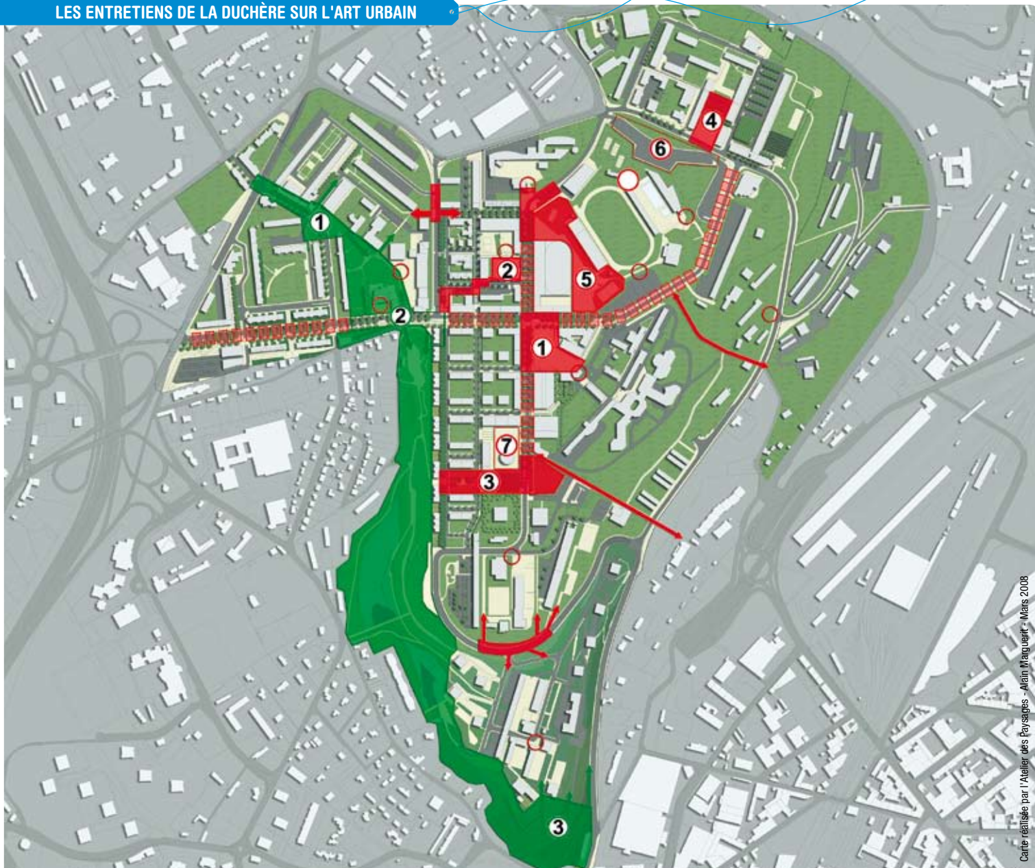
Carte réalisée par l'Atelier des Paysages - Alain Marguerit - Mars 2008